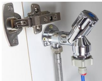
Abb. Eingangsventil EGV-2 Untertisch

Mit einem Eingangsventil kann die Anlage eingangsseitig auf- und zuge dreht werden. Hier 2 Ausführungen: