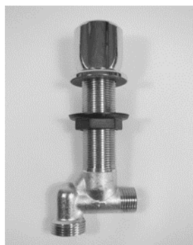
Abb. Eingangsventil EGV-1 als Durchführung z.B. durch die Küchenarbeitsplatte