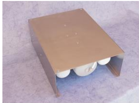
Abb. DF1-ESU (Edelstahlchassis in U-Form)