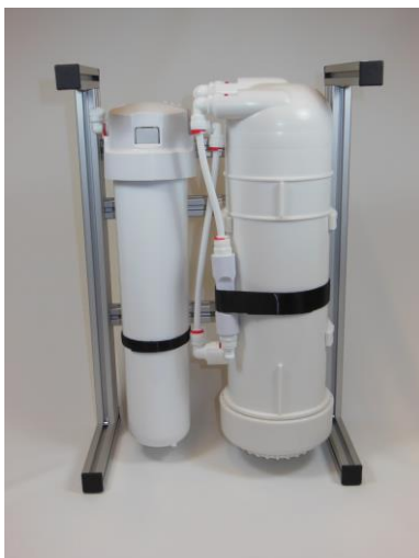
Abb. DF1-k (kompakt)