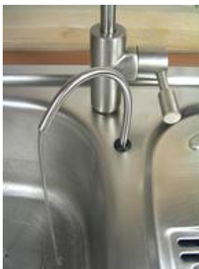
Abb. Freier Spülwasser- auslauf FSWA. Wir bieten 2 verschiedene Modelle an. Weitere Informationen hierzu siehe Produktdatenblatt Nr. 13.